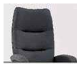
Záda 2 Výška: 109–113 cm Délka v ležaté poloze: 168–173 cm