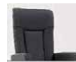
Záda 3 Výška: 112–116 cm Délka v ležaté poloze: 171–176 cm