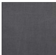
DARK GREY F032