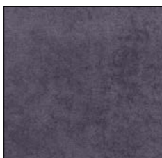
DEEP BLUE G705