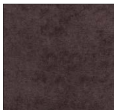
DEEP BROWN G701